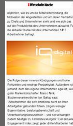
Mobile Banner 2:1