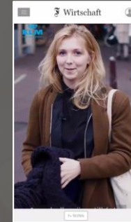
Mobile InTxT Vertical