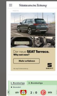
Mobile Premium Rectangle (Mobile Groß)