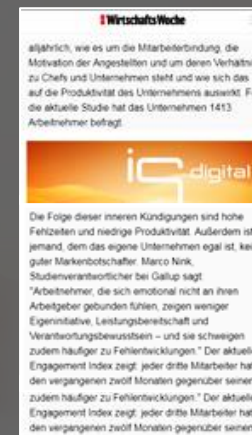
Mobile Banner 4:1