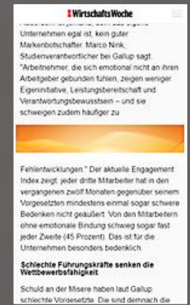
Mobile Banner 6:1